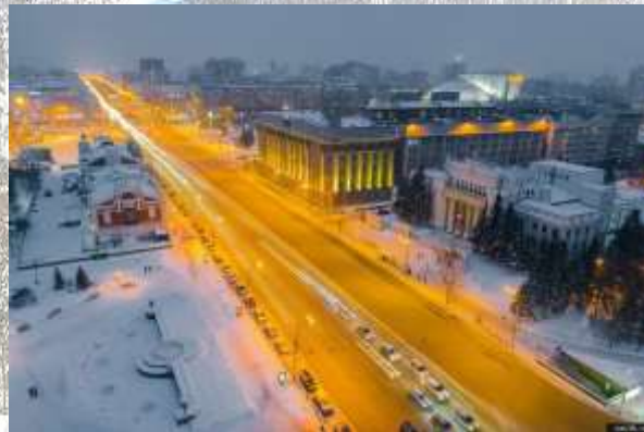
Самая длинная прямая улица в мире Красный проспект