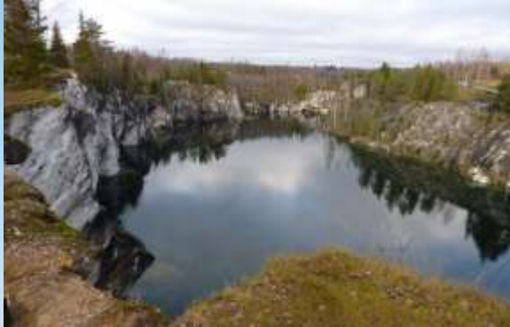
Мраморный карьер в Искитимском районе