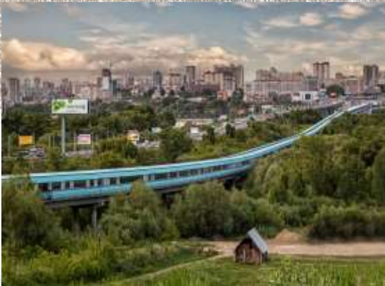
Самый длинный в мире метрополитен