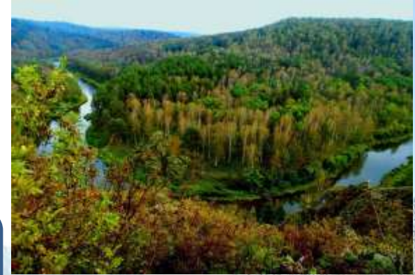
Река Бердь (Искитимский район) - приток Оби