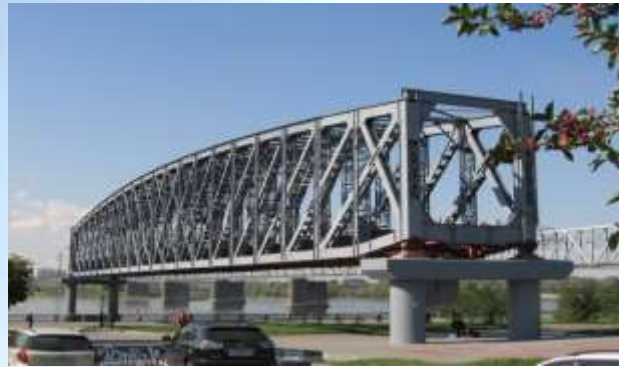
Памятник железнодорожному мосту